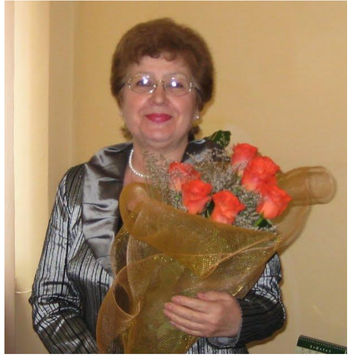
Після нагородження відзнаками міжнародного проєкту «Україна й українці – цвіт нації, гордість країни». м. Київ, квітень 2011 р.